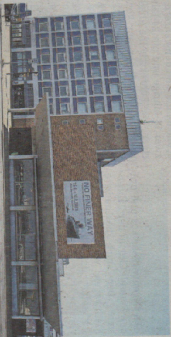
NZ-Leser hatten den Columbusbahnhof als Alternativstandort vorgeschlagen. Das Gebäude, für das Bremenports zuständig ist, soll saniert werden. Dauer: mehrere Jahre.

Die existiert - zumindest noch nicht. „Die Stadt hat kein geeig-